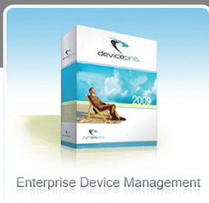
Enterprise Device Management